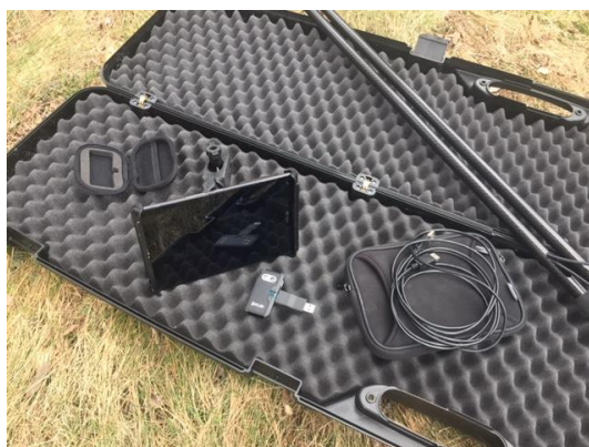
Obr. 7 Souprava vyhledávače VMT – VÚZT obsahuje volitelný tablet a termovizi Flir One

Vyhledávač je možné využít pro vyhledávání kadaverů divokých prasat při prevenci šíření afrického moru prasat. Výrobu tohoto zařízení bude zabezpečovat Výzkumný ústav zemědělské techniky, v. v. i. na základě objednávky podle konkrétních požadavků. Budou připraveny různé varianty s ohledem na možnosti dalšího využití termovize a také podle ceny. Cena základního provedení je 39 tis. Kč bez DPH.