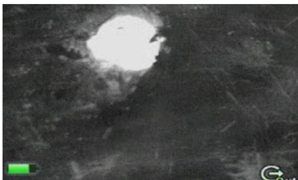
Obr. 4 Zobrazení srnčete z obr. 5 na monitoru vyhledávací tyče s termovizí