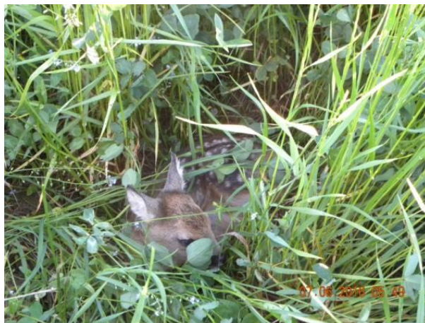
Obr. 5 Srnče nalezené pomocí vyhledávací tyče s termovizí