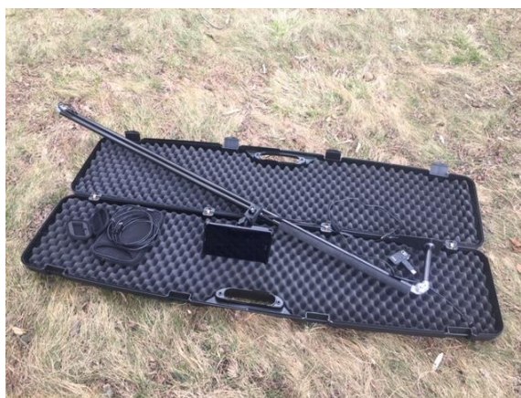
Obr. 6 Souprava vyhledávače VMT - VÚZT