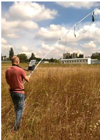
Obr. 2 Ověřování funkčního vzorku vyhledávací tyče s termovizí