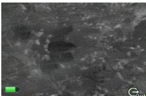
Obr. 3 Zobrazení porostu při monitorování pomocí vyhledávací tyče s termovizí