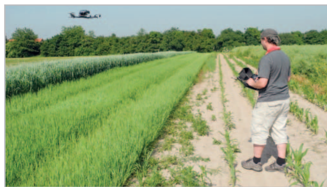
Osmivrtulový bezpilotní prostředek, model AscTec Falcon 8

Zatímco parta techniků zvládne během dne zkontrolovat tři sloupy, pomocí dronu je možné jich zkontrolovat za den až 15. Firma Upsilon, která při kontrole přenosové soustavy spolupracuje s energetickou společností E-ON konstatuje: „Není to ale tak, že by měly vzít práci lezcům, ale naopak umožňuje je efektivně posílat jen tam, kde je to opravdu potřeba“. Robot totiž stále nedokáže objevené poruchy sám odstranit, tuto práci proto musí za něj nakonec přijet udělat člověk. Povinnosti