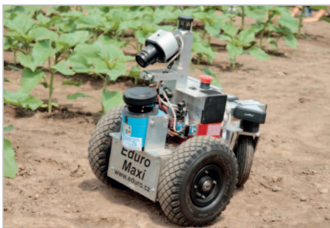
Robot Eduro Maxi, který reprezentuje náš tým na soutěžích

Z hlediska praktické využitelnosti se momentálně jeví jako nejvyvinutější metody využití bezpilotních dronů pro monitoring aktuálního stavu (půdy, porostu, trasy atd.) s následným využitím jako vstupních dat pro modelová i praktická řešení v praxi. Jedná se například o zís-