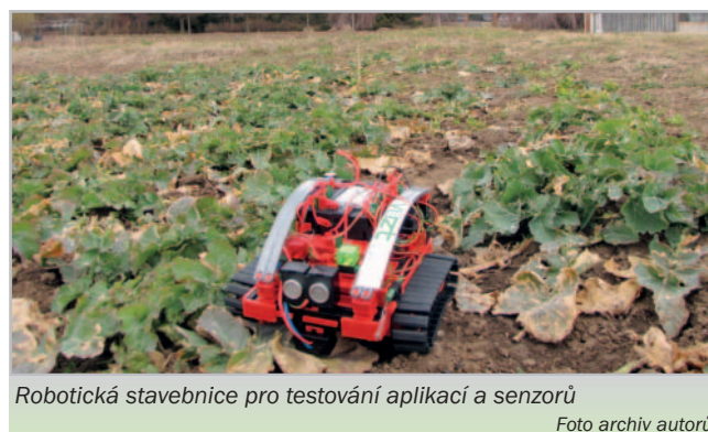
Robotická stavebnice pro testování aplikací a senzorů

Společnost ČEPS, správce elektrické přenosové soustavy, která v Česku provozuje energetickou přenosovou soustavu, si pořídila tři drony, které jí pomáhají hlídat