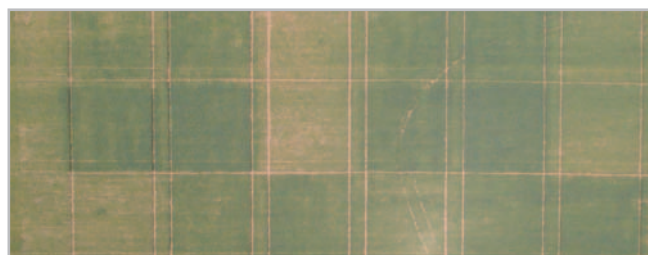
Snímek pozemku z dronu v podobě klasické barevné fotografie