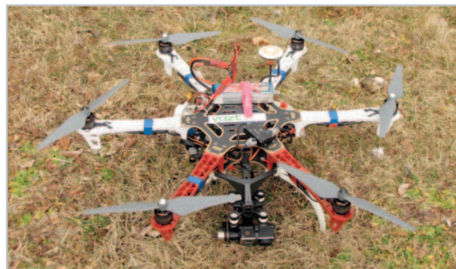
Dron VÚZT pro experimentální využití v zemědělství

V Česku má nejprodávanější model dronu přes tisíc lidí. Váží sice jen 1,3 kilogramu, nikdo však nemůže zaručit bezpečnost jeho létání. Právě kvůli obavám z pádu nesmějí drony nad lidmi v Česku létat. Zakázané je používání dronů i u letišť, jinak se s nimi však smí nakládat celkem svobodně. Zákonné omezení platí pouze pro kusy s hmotností nad 20 kilogramů. Jejich majitelé se ale často dostávají do střetu se zákonem, jelikož nemají potřebnou licenci. Pokuty padají i za černé přivýdělký získané pomocí tzv. dronů. Úřady ovšem nevylučují, že by se předpisy pro jejich