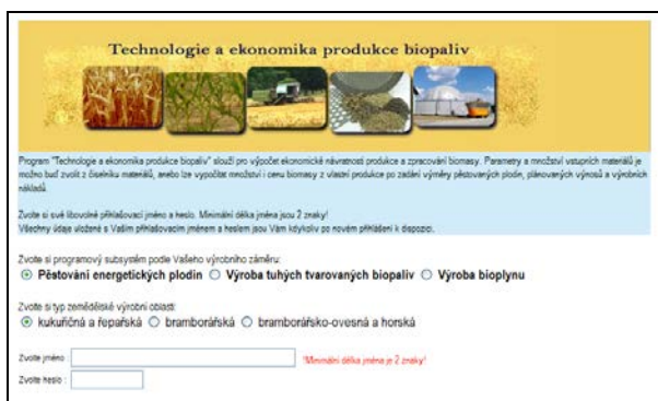
Obr. 2: Úvodní obrazovka expertního systému

- výroba bioplynu - výsledným produktem je bioplyn a jeho kombinované využití pro výrobu elektrické energie a tepla, případně úprava bioplynu na biometan