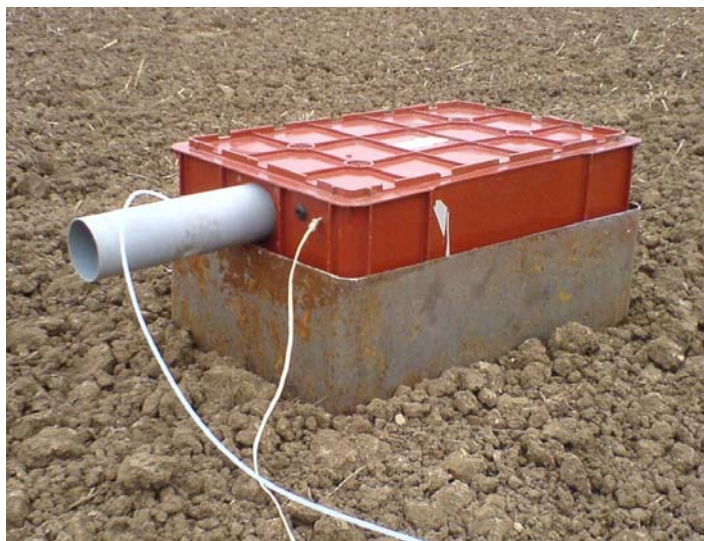
Obr. 1: Odběrová komora s plechovým límcem.

Na obr.3 jsou průběhy teploty, relativní vlhkosti a tlaku vzduchu v průběhu měření.