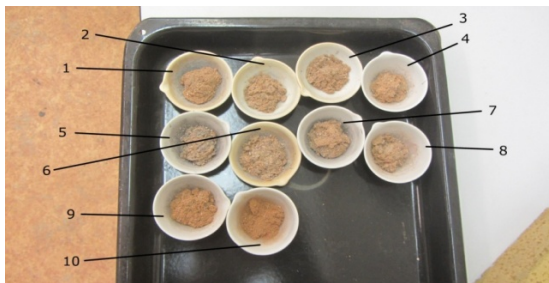
Obr. 3. Vzorky konopí biomasy po vyjmutí z muflové pece

m_f – celková hmotnost vzorku po spálení (g)