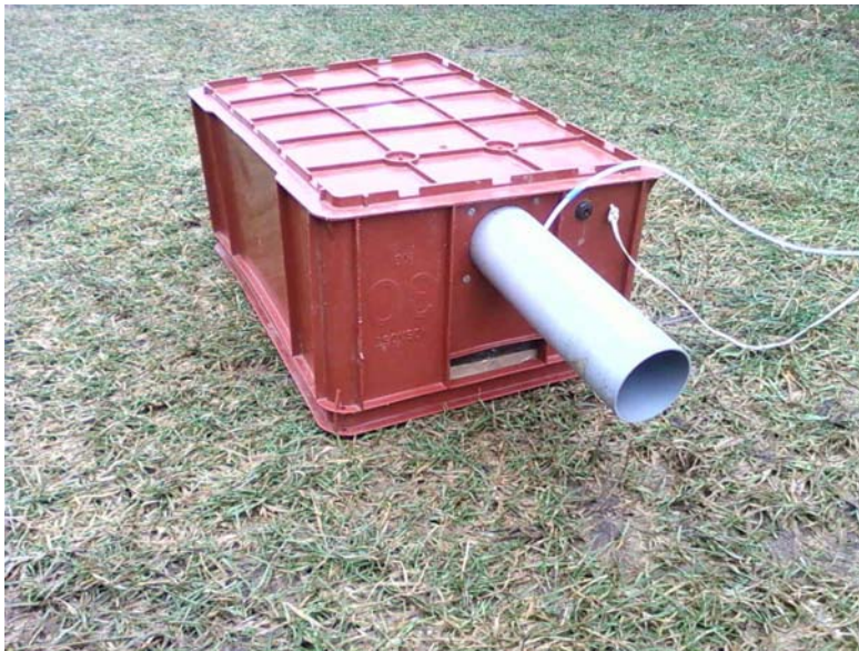
Obr. 1: Odběrová komora.

rozstříkem a zapravením hadicovým aplikátorem byly na půdu s porostem umístěny inovované odběrové komory s nuceným průtokem vzduchu, navržené a zhotovené v předešlém roce v rámci řešení výzkumného záměru. Komory o půdorysu 50 x 60 cm a výšce 30 cm byly osazeny odtahovým ventilátorem a v protilehlé stěně byly vyvrtány nasávací otvory. Po celou dobu měření byl nastaven průtok vzduchu ventilátorem tak, aby byla zajištěna rychlost proudění vzduchu nad sledovaným povrchem uvnitř komory na hodnotu 0,06 \text{ m}\cdot\text{s}^{-1} . Tomu odpovídá průtok vzduchu komorou 32,4 \text{ m}^3\cdot\text{h}^{-1} . Odběrové sondy byly umístěny v proudu vzduchu za odtahovými ventilátory. Odběrová komora je na obr.1.