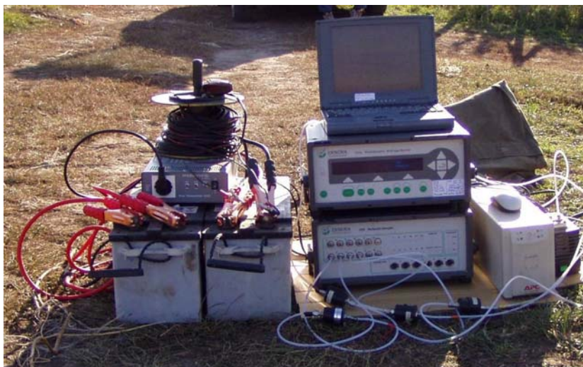
Obr. 2: Měřicí aparatura