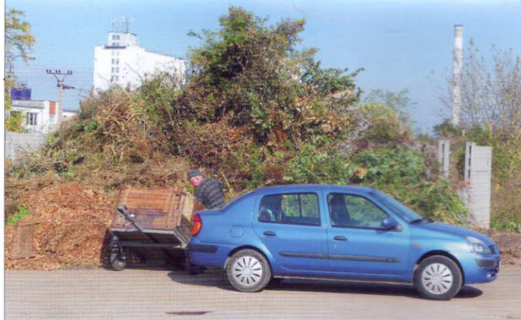
Dovoz bioodpadů vlastními dopravními prostředky