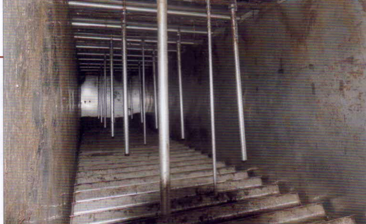
Vnitřní prostor aerobního fermentoru EWA