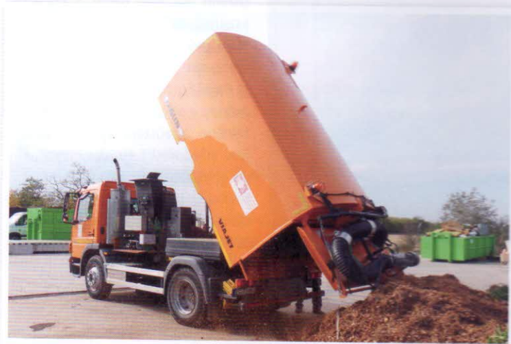
Nákladní automobil Mercedes-Benz s nástavbou FAUN ViaJet

dřevní odpad – prořezy větví, štěpka apod.) a vytříděný bioodpad (BRKO). Pro sběr BRKO v Želiezovcích slouží nádoby na bioodpad – hnědé kontejnery o obsahu 240 l, které jsou rozmístěny mezi obyvateli hlavně v zástavbě rodinných domů. Svoz surovin z těchto popelnic do kompostárny je zajišťován nákladním automobilem MAN s nástavbou ROTOPRESS pro vyprazdňování hnědých kontejnerů. Do centra na zhodnocení BRO bioodpad dováží