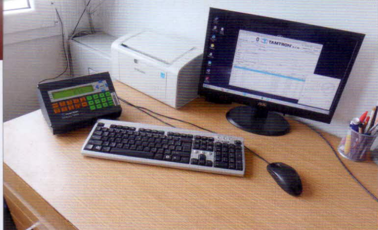
Informace o průběhu kompostovacího procesu dodávané bezdrátově do PC