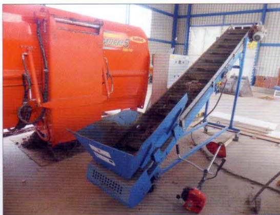
Lehký pásový dopravník

složením). Spotřeba elektrické energie na zpracování 1 t bioodpadu činí 8,0 kWh/t. Veškeré další operace ve fermentoru probíhají automaticky, řízeny jsou počítačem. Optimální vlhkost zakládky (50–60 %) a dostupnost vzdušného kyslíku aktivují aerobní proces. Automatickým vzdušněním a překopáváním uvnitř aerobního fermentoru dochází k provzdušňování zakládky, dochází k rychlému náběhu hygienizačních teplot (nad 70 °C), zvyšuje se úroveň metabolické aktivity a současně množení bakterií, čímž dochází k aerobní termofilní stabilizaci a hygienizaci zakládky, při čemž dochází k potlačení patogenních mikroorganismů a semena plevelů ztrácejí svou klíčivost. Kompostovací proces probíhá za