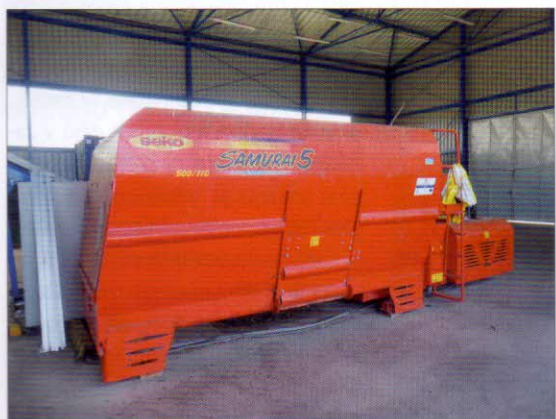
Míchací a vázicí stroj SEKO