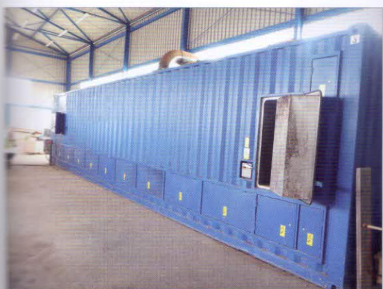
Aerobní fermentor EWA – Ecological Waste Apparatus