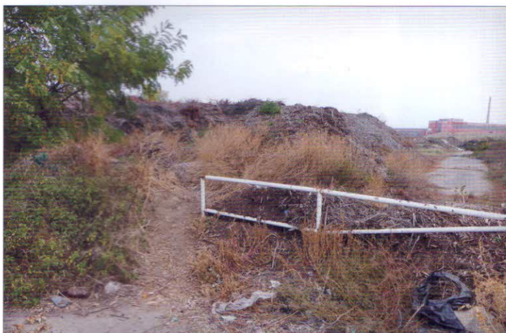
Dřevní suroviny uloženy na pomocné ploše k pozdějšímu zpracování

Hlavní součástí technologické části kompostárny je aerobní fermentor