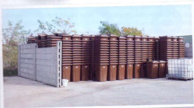
Hnědé kontejnery pro svoz bioodpadu