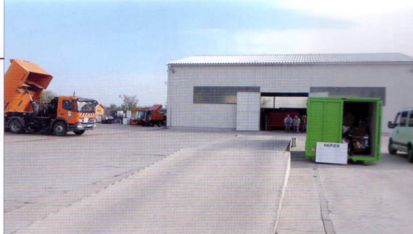
Stacionární silniční nájezdová váha

také nákladní vozidlo Mercedes-Benz s nástavbou FAUN ViaJet – zametací stroj, který vysává posečenou trávu a listí na městských pozemcích.