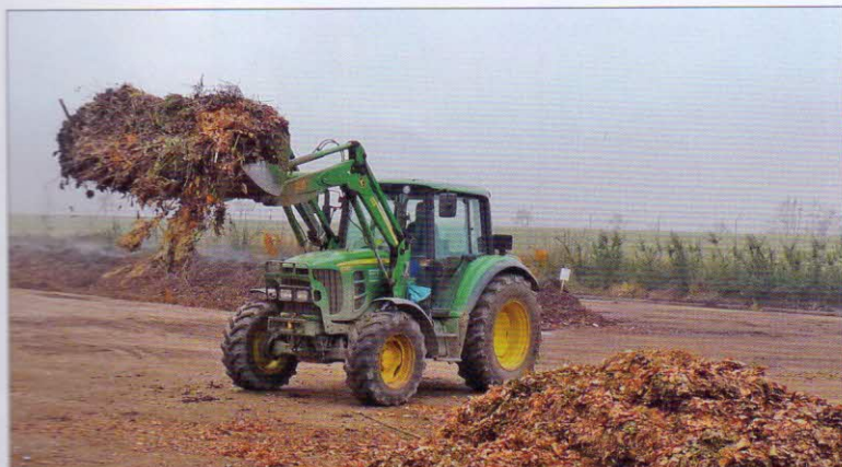
Energetický prostředek, manipulace se surovinami – kolový traktor JOHN DEERE 6230 s dieselovým motorem 74 kW. Traktor je vybaven čelním nakladačem s lopatou o objemu 2,5 m 3

vým prahem. Plocha je podélně vyspá- dovaná (sklon 3 %) s příčným sklonem 1,5 % na kraj plochy, kde je umístěn vtok do soustavy nádrží skládající se z kalové jímky o objemu 1 m 3 a zásobní jímky o objemu 397 m 3 , ve které jsou shromažďovány vody odtékající z kompostovací plochy a kalové jímky