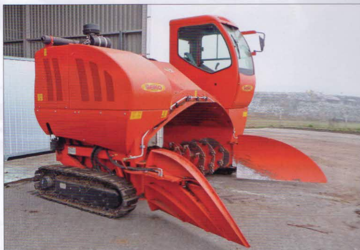
Překopávání kompostu – samojízdný překopávač kompostu SEKO SCV 320 MD s dieselovým motorem 62 kW, pracovním prostorem (š x v) – (3,2 x 1,3) m a výkonností 250–900 m 3 /h podle vlastností materiálu, je vybaven zavlažovacím adaptérem

a jsou využívány ke zvlhčování založených hromad.