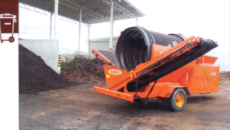
Prosévání kompostu – bubnové síto SEKO Separátor 50 MD je poháněno dieslovým motorem s výkonem 62 kW. Třídící výkon do 50 m 3 /h podle vlastností materiálu. Velikost oka síta 30 x 30 mm