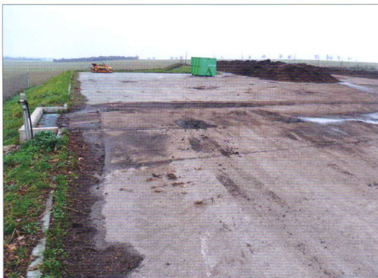
Systém podzemní soustavy nádrží – znečištěná voda z vyspádované kompostovací plochy je svedena do systému podzemní soustavy nádrží umožňující bezproblémové nakládání se srážkovými vodami spadlými na kompostovací plochu. Celkový objem systému podzemní soustavy nádrží je 397 m 3