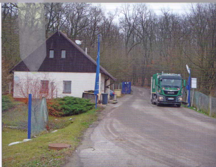
Vážení přijímaného BRKO na silniční mostové váze typu Lesyco