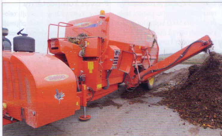
Drcení, promíchávání a homogenizace surovin – sběrný drtící a míchací kompostářský vůz SEKO SAMURAJ 5 500/150-GC MD má objem pracovního prostoru 11 m 3 a výkonnost asi 5 m 3 /h podle vlastností materiálu