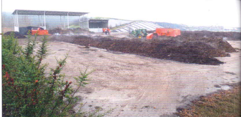
Venkovní kompostovací plocha je vodohospodářsky zabezpečená s asfaltovým povrchem o celkové výměře 4670 m 2 , s betonovými obrubníky, v místě příjezdu je vybavena přejezdovým prahem. Plocha je podélně vyspádovaná –3 % s příčným sklonem 1,5 % na kraj plochy, kde je umístěn vtok do podzemní jímky. Plocha je rozdělena na dvě části: 1. plocha pro kompostování – 3864 m 2 , 2. manipulační plocha 13 x 62 m – 806 m 2