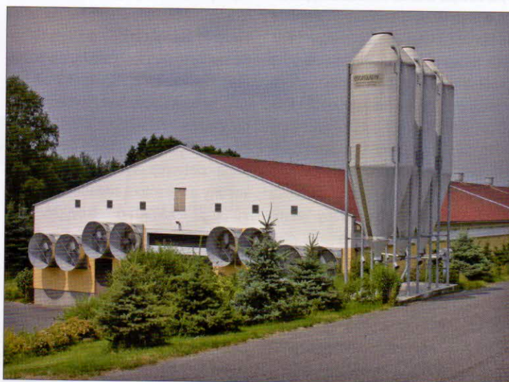
Mikrobiální kontaminace stájového prostředí je závislá na technologických systémech v objektu

V bioaerosolech stájí se vyskytují vysoké koncentrace bakterií a plísň produkujících toxiny. Mezi dominantní, veterinárně významné patogenní mikroorganismy patří plíseň rodu Aspergillus , bakterie rodu Staphylococcus , Streptococcus , Enterococcus , Salmonella , Escherichia coli a Clostridium . Důsledné sledování urovně mikrobiologické kontaminace je nezbytné pro volbu účinné dezinfekce stájových prostor.