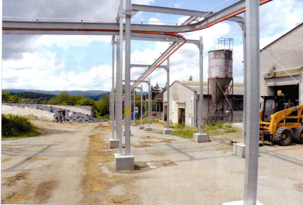
Obr. 7 – Konstrukce pro uchycení kolejnic pro přemístění AMKV do stájí

AMKV se u každého zásobníku staví a přijme požadované přesně odvážené množství komponenty PMR podle naprogramované krmné dávky. Zbytek koncentrovaných krmiv dostanou dojnice u dojícího robota. Krmivo se do bunkerů zakládá pomocí manipulátoru s čelním drapákem nebo přímo vykusovačem siláže a senáže. Proto je vhodné, aby byly silážní a senážní žlaby umístěny blízko přípravy. Na farmě v Záluží je přípravná situována ve velkém seníku prakticky vedle senážních žlabů a asi 20 a 25 m od obou stájí.