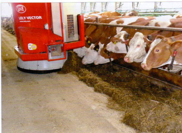
Obr. 3 – Přihrnování a doplňování krmiva na krmný stůl