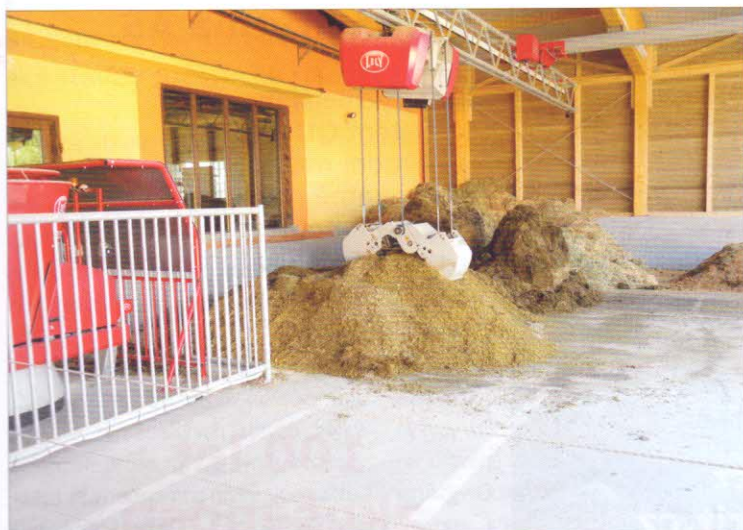
Obr. 1 – Přípravna krmných dávek se lžicovým drapákem na farmě manželů Dubových v Boubíně

Automatický míchací krmný vůz (AMKV) je koncipován jako samostatná samojízdná jednotka s elektropohonem kol a mechanismů a řídicím systémem, jehož trasa pohybu po podlaze je řízena indukčními čidly a ocelovými pásy umístěnými v pod-