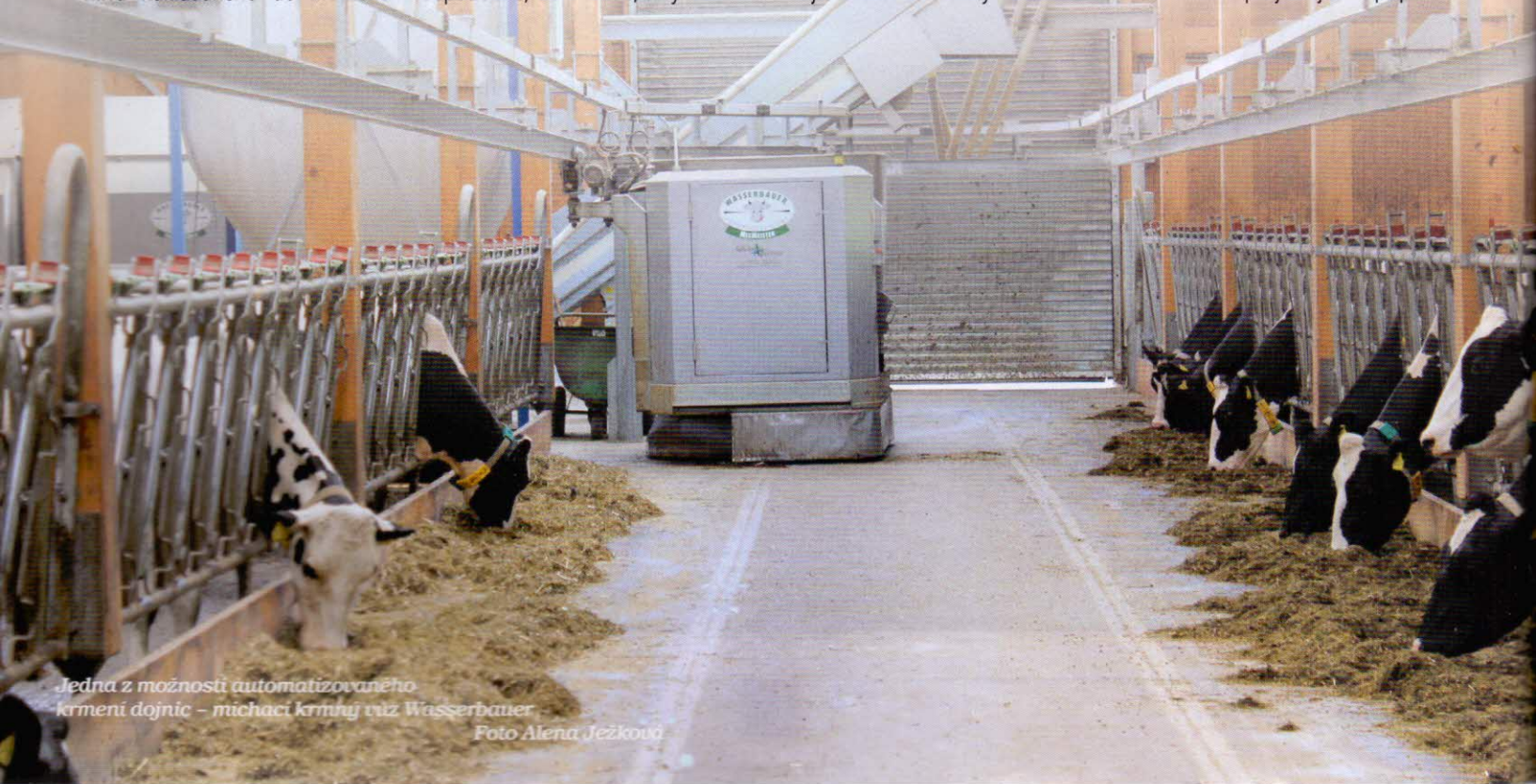
Jedna z možností automatizovaného krmení dojníc – míchací krmný vůz Wasserbauer

Přípravná krmných dávek sestává z pěti zásobníků (bunkerů) objemných komponent krmné dávky, dvou zásobníků krmných směsí a čtyř dávkovačů dalších krmných aditiv. Každý bunker má objem 18 m 3 a pojme až osm tun objemného krmiva (obr. 4 a 5). Krmivo je v bunkeru podáváno dopředu a šikmo nahoru hrabičkovým podlahovým dopravníkem ke dvěma rotačním rozdrůzovacím a dávkovacím bubnům, které krmivo dávkuje do AMKV projíždějícího přípravnou.