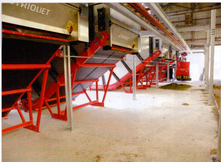
Obr. 5 - Zásobníky objemných komponent krmné dávky ze strany dávkování do AMKV