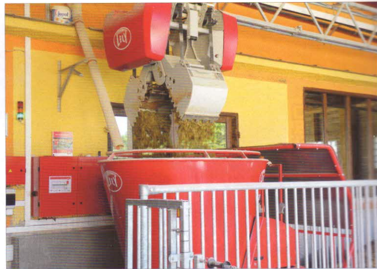
Obr. 2 – Zakládání krmiva do automatického míchacího krmného vozu v depu