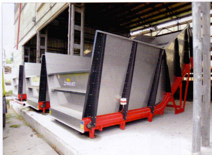
Obr. 4 – Zásobníky objemných komponent krmné dávky ze strany naplňování

laze stáje. Zdrojem elektrické energie jsou čtyři 12V baterie, které se dobíjí v depu i při nakládání krmiva. V korbě se nachází jeden vertikální šnek poháněný 3kW motorem a zařízení pro dávkování krmiva na krmný stůl poháněné 0,54kW motorem.