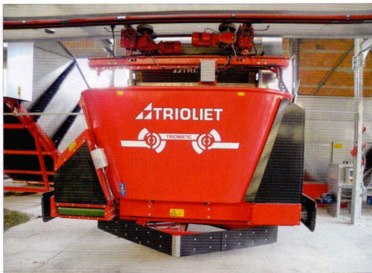
Obr. 6 - Automatický míchací krmný vůz Triomatic v přípravně

výsledků těchto rozhodnutí. Všechny části systému spolu komunikují pomocí bezdrátového rozhraní bluetooth. Farmář tak může zadávat pokyny do řídicího systému pomocí chytrého mobilního telefonu s operačním systémem Android a dostává i poruchová hlášení.